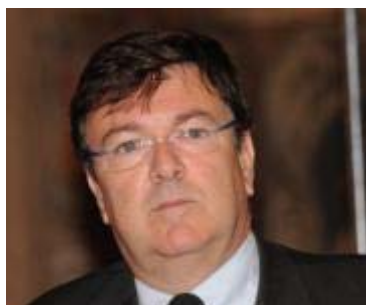
Paolo Zamboni

Ferrara, 2 luglio 2010 - La Regione Emilia-Romagna dà l'ok al protocollo per la ricerca sulla sclerosi multipla di Paolo Zamboni e dell'Ateneo di Ferrara. All'incontro tra il gruppo tecnico regionale e l'equipe del professore che si è svolto oggi sono stati discussi tutti gli aspetti critici della sperimentazione clinica per valutare l'efficacia del trattamento della Ccvi (Chronic cerebro-spinal venous insufficiency, insufficienza venosa cerebro-spinale) nei pazienti con sclerosi multipla. invia per E-mail | condividi