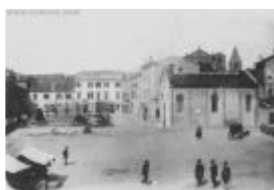
Piazza Torquato Tasso