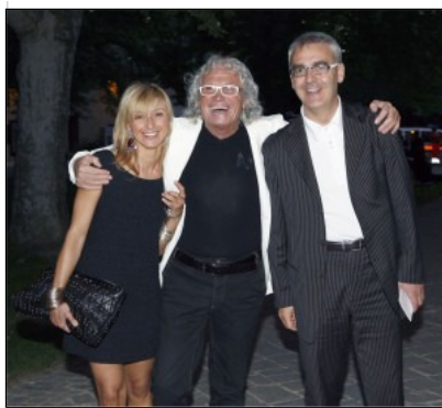
Giulio Golia de "Le Iene" all'Abbazia di Fiastra

Nel corso della serata sono state vendute opere messe a disposizione da Gallerie d'arte e artisti della nostra provincia. I fondi ricavati dalla vendita saranno destinati alla promozione dell'associazione CCSVI e all'avanzamento delle ricerche mediche sulla malattia.