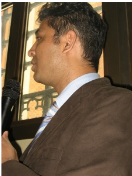
Il neurochirurgo Adnan Siddiqui