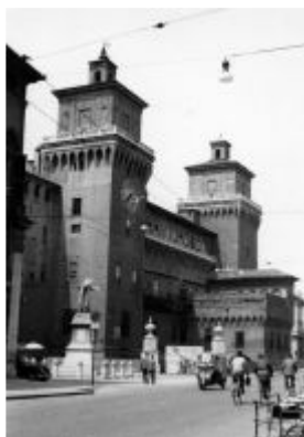
Ferrara anni 50